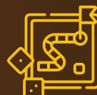
Risk Management Game-Based Simulation